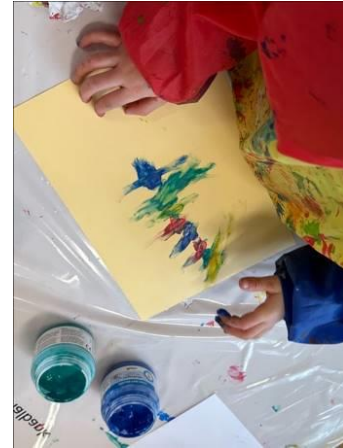
«Ich mache s` Gliche wie du.»