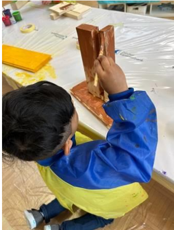
«Ich ha so gern mit Holz geschafft und ghämmeret.»