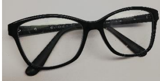
2 - Schwarze Sonnenbrille mit Blumenmuster