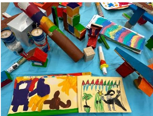
«Ich bi eifach müed!»