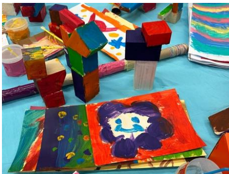
«Mir hend mit dä Bauklötz Hockey gspielt.»