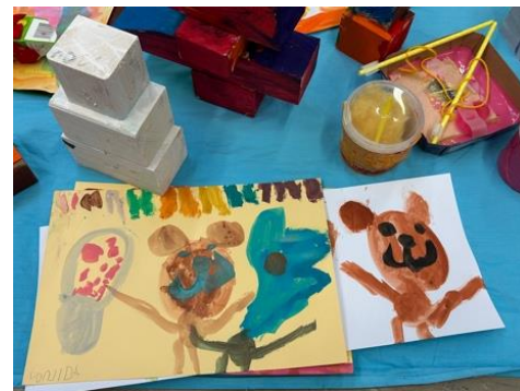
«Es isch soo cool!»