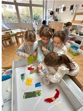
«Ich ha so viel bastled mit riesige Kiste.»