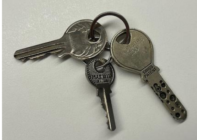
15 – Schlüsselbund, wurde im Volg gefunden