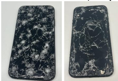
7 - Schwarzes iPhone, zersplittert