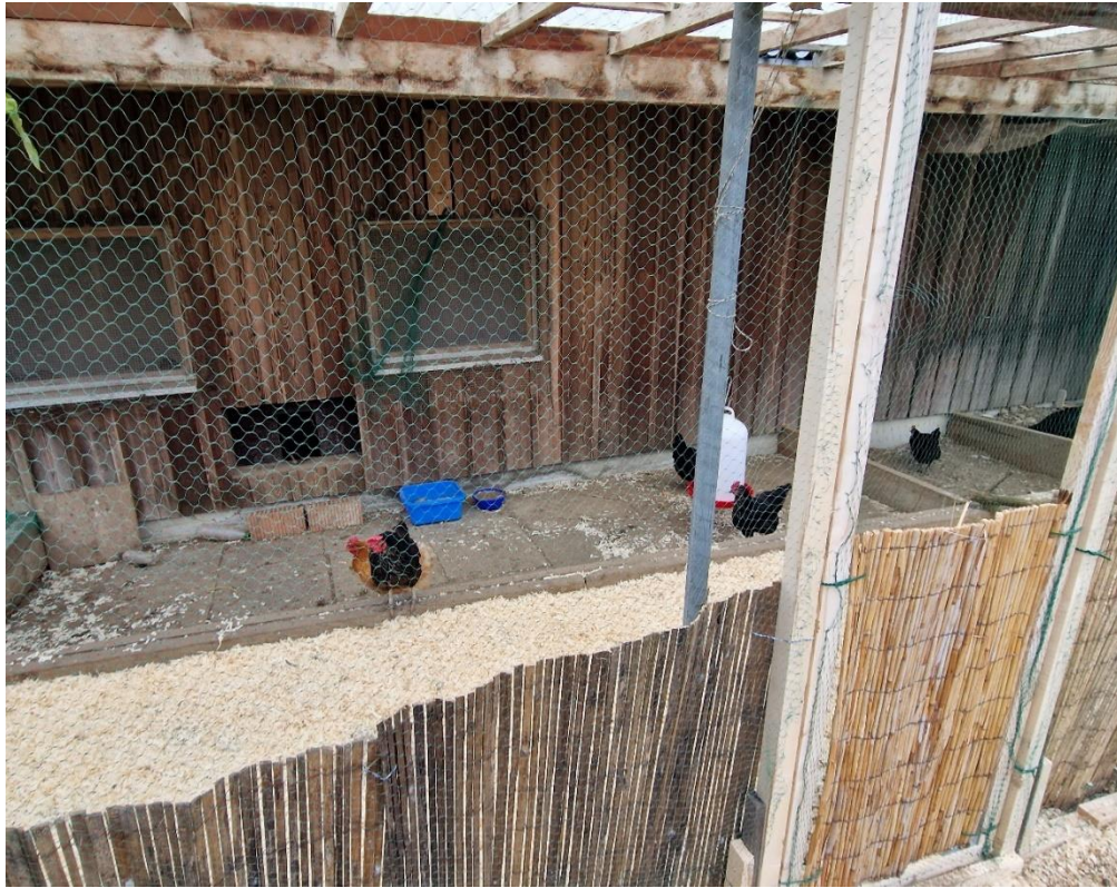
Bildlegende: Hühnerstall für 20 Tiere, der Wintergarten mit festem Dach und Netzen an den Seiten, die unten vor Beschädigung durch Picken geschützt sind.

Ein direkter Link auf die Online-Registrierung von Geflügel ist auch auf der Spezial-Website www.zh.ch/vogelgrippe zu finden. Ebenda sind Infos und Merkblätter abgelegt, z. B. zu Wintergärten und Hygieneschleusen oder das Plakat «Kein Zutritt zur Geflügelhaltung». Die Geflügelhaltenden tun gut daran, es als Vorsichtsmaßnahme an ihren Gehegen anzubringen.